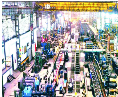
A S MITTAL

The first budget by NDA-3 is anticipated to address the demands of stakeholders and States seeking assistance to bridge regional disparities